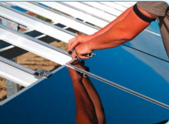
Modul-Montage im August 2011.

Nun begann der Wettlauf mit der Zeit, um möglichst rasch den Status einer eingetragenen Genossenschaft zu erreichen. Der Zeitplan war ehrgeizig: Noch vor Weihnachten sollten Kauf- und Finanzierungsver-