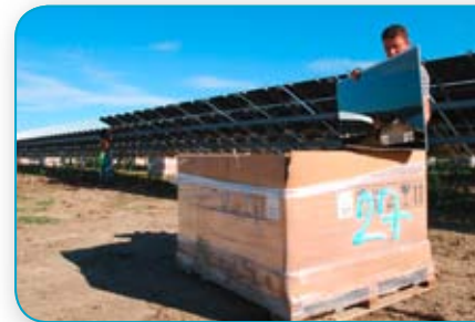
Auch die Bauzeit war Rekord: Tonnen an Stahl, kilometerlange Kabel und über 60 000 PV-Module sind installiert worden.