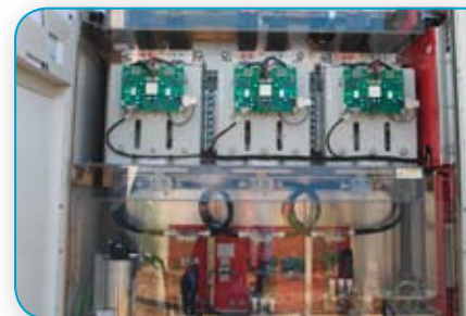
Technik die begeistert. Auch das „Innenleben“ der Anlage ist sehr beeindruckend.